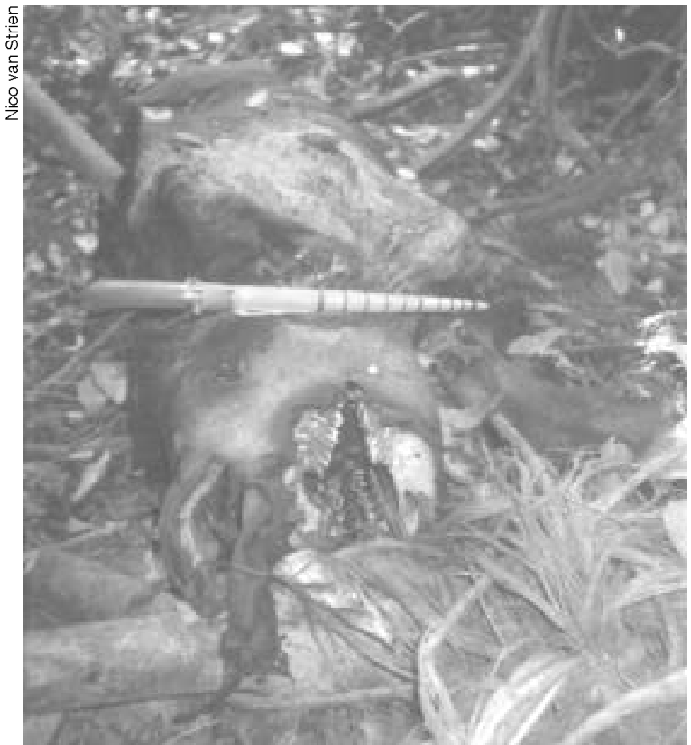
The aftermath of rhino poachings.

La situation de la conservation en Indonésie est toujours plus pénible. Depuis 1995, il existe un programme qui comprend des équipes anti-braconnage, connues sous le nom d'unités de protection des rhinos ou « RPU » qui opèrent dans les principales régions où l'on sait qu'il subsiste des rhinos de Sumatra.